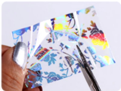
1. Wytnij kawałek folii