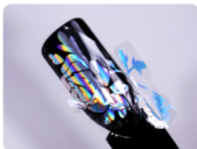
5. Dociśnij folię do paznokcia