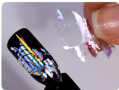
6. Odklej folię