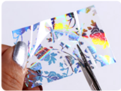
1. Wytnij kawałek folii