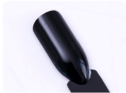
3. Poczekaj aż klej wyschnie