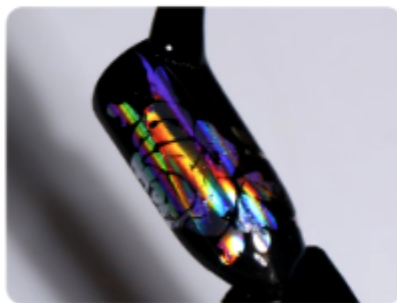
7. Zabezpiecz paznokieć lakierem bezbarwnym