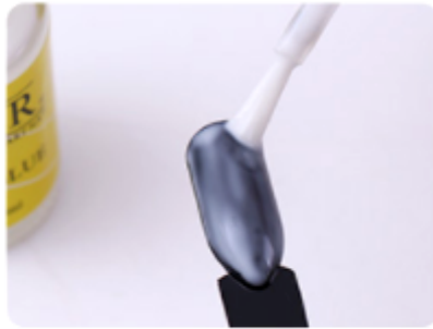
2. Nałóż klej do folii transferowej