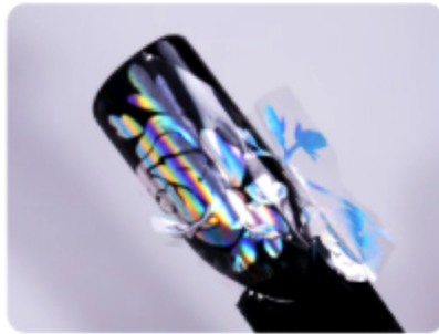
5. Dociśnij folię do paznokcia