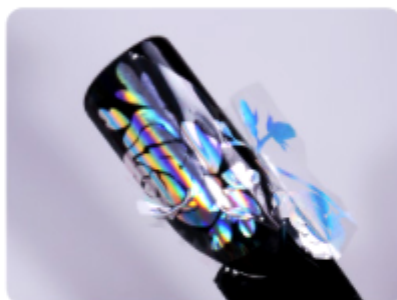
5. Dociśnij folię do paznokcia