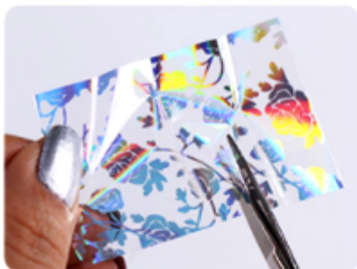
1. Wytnij kawałek folii

Następnie pomalować top coatem i utrwalić w lampie UV.