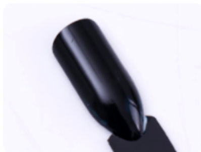
3. Poczekaj aż klej wyschnie