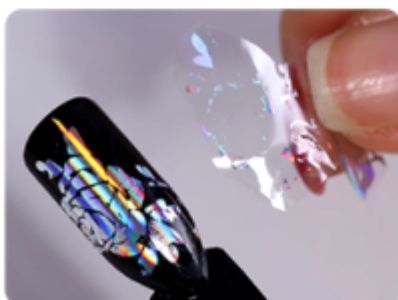
6. Odklej folię