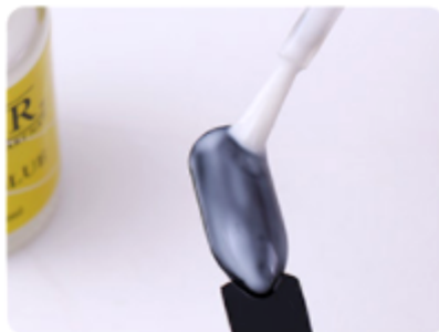
2. Nałóż klej do folii transferowej